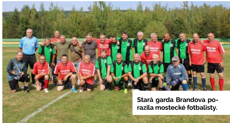
Stará garda Brandova porazila mostecké fotbalisty.

Utkání staré gardy Brandova lo vítězně pro domácí tým. Tradice starou gardou Mostu dopadla vítězně pro domácí tým. Tradiční letní fotbalový zápas je ale