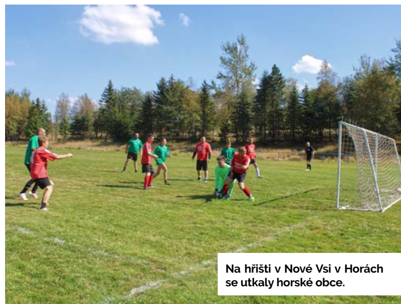
Na hřišti v Nové Vsi v Horách se utkaly horské obce.

Další fotbalová tradice – utkání tří horských obcí Brandova, Hory Sváté Kateřiny a Nové Vsi v Horách – se letos přesunulo na novoveské fotbalové hřiště. Turnaj byl součástí česko-německého projektu Přátelství bez hranic/Freundschaft ohne Grenze. Pohár pro vítěze převzalo mužstvo Hory Sváté Kateřiny, následoval Brandov, třetí skončili domácí. Po tomto turnaji pokračovalo fotbalové odpoledne zápasem Staré gardy z Česka a mužstva Oldies ze Saska, který