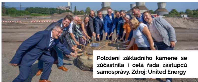
Položení základního kamene se zúčastnila i celá řada zástupců samosprávy.

V areálu teplárny Komořany u Mostu proběhlo na konci srpna slavnostní zahájení stavby zařízení pro energetické využití odpadu (ZEVO). Nový nízkoemisní zdroj významně přispěje k postupnému odklonu teplárny od uhlí a snižování ekologické zátěže z odpadů Ústeckého kraje i České republiky.